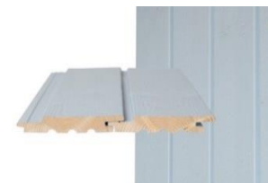
HS UTS p Pystypanelointi