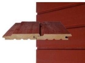
HS UTV p Vaaka- ja pystypanelointi