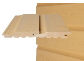
HS UTK p Vaakanelointi