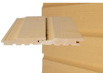
GOLD PRO UTK Vaakapanelointi