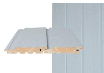
GOLD PRO UTS Pystypanelointi