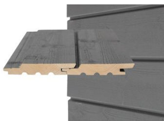
GOLD PRO UTW Vaakapanelointi