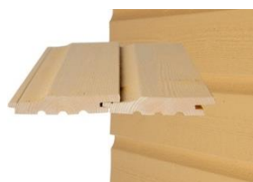
HS UTK p Vaakapanelointi