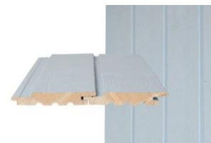
HS UTS p Pystypanelointi