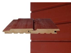
HS UTV p Vaaka- ja pystypanelointi