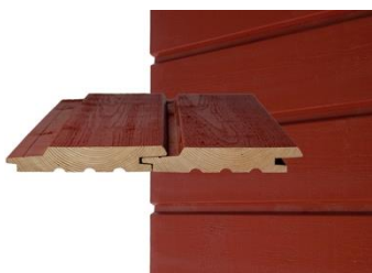
GOLD PRO UTV Vaaka- ja pystypanelointi